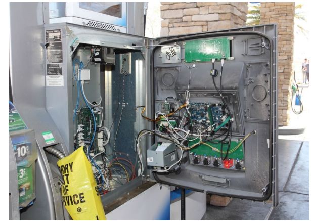
Un skimmer detrás de una bomba de la estación de servicio.