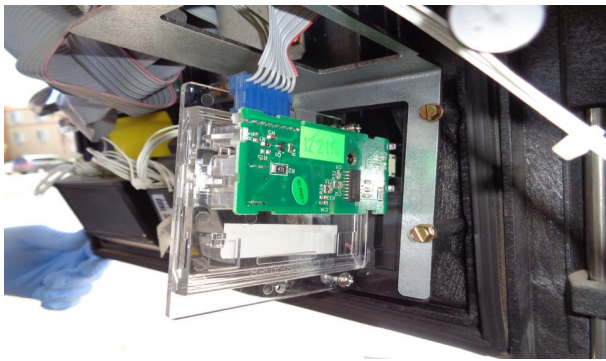
Un skimmer instalado dentro de un ATM.